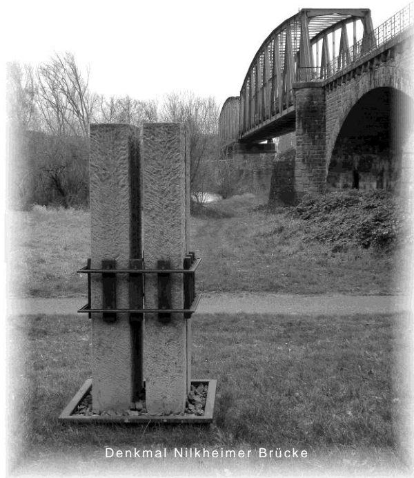
Denkmal Nilkheimer Brücke